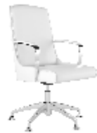
КРЕСЛО РУКОВОДИТЕЛЯ [ Олимпия-М ] Ш: 70 см. / Г: 60 см. / В: 75 см.