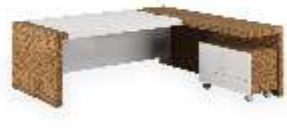
СТОЛ ПИСЬМЕННЫЙ [ KY 22U ] Ш: 226 см. / Г: 209 см. / В: 75 см.