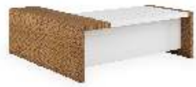
СТОЛ ПИСЬМЕННЫЙ [ KY 20U ] Ш: 206 см. / Г: 209 см. / В: 75 см.