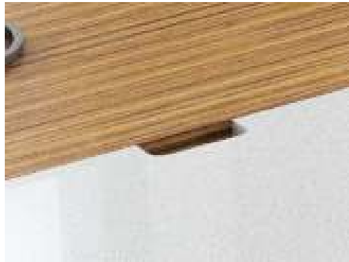
ОТВЕРСТИЕ ДЛЯ ПРОВОДОВ В СТОЛЕШНИЦЕ ПИСЬМЕННОГО СТОЛА