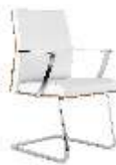
СТУЛ [ Алтея-L ] Ш: 62 см. / Г: 52 см. / В: 88 см.