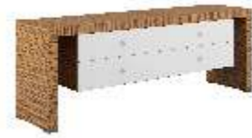
ГРЕДЕНЦИЯ [ KYG 2090 ] Ш: 210 / Г: 50 / В: 69,6