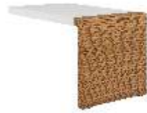
БРИФИНГ-ПРИСТАВКА [ KY 1470 ] Ш: 140 см. / Г: 70 см. / В: 75 см.