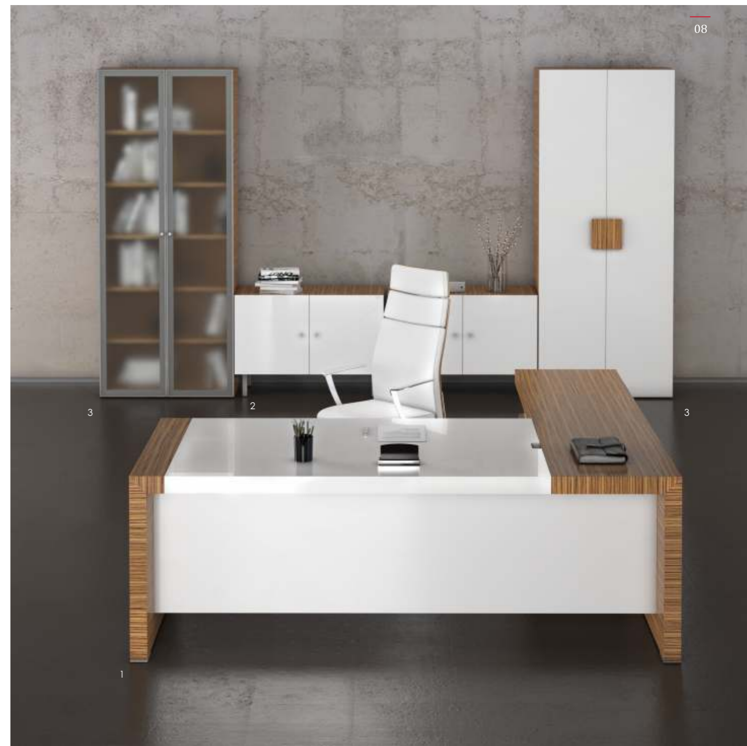
1: Греденция [ KYG 2090 ].

Легкие, ясные линии письменных столов коллекции KYU гармонично сочетаются с цветом и фактурой материала – шпоном из древесины зебрано. Благодаря особой обработке древесины - технике нанесения лака с «открытыми порами» - естественные цвета зебрано радуют глаз яркостью и красотой.