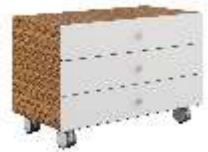
ТУМБА ПОДКАТНАЯ [ KY M80 ] Ш: 80 см. / Г: 45 см. / В: 50 см.