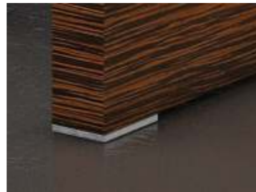
ВСТАВКИ ИЗ МАССИВА БУКА НА ОПОРАХ И БОКОВЫХ ТУМБАХ, ОКРАШЕННЫЕ СЕРЕБРИСТОЙ КРАСКОЙ