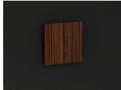
ОРИГИНАЛЬНЫЕ ШПОНИРОВАННЫЕ РУЧКИ ШКАФОВ