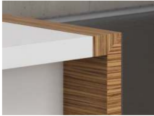
СОЧЕТАНИЕ ТЕКСТУР ШПОНА НА ТОРЦАХ