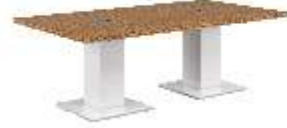
СТОЛ СОВЕЩАНИЙ [ KY 2212 ] Ш: 220 см. / Г: 120 см. / В: 75 см.