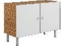
ГРЕДЕНЦИЯ [ KY 1040 ] Ш: 100 см. / Г: 42 см. / В: 69,5 см.