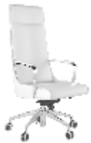
КРЕСЛО РУКОВОДИТЕЛЯ [ Олимпия ] Ш: 70 см. / Г: 60 см. / В: 100 см.